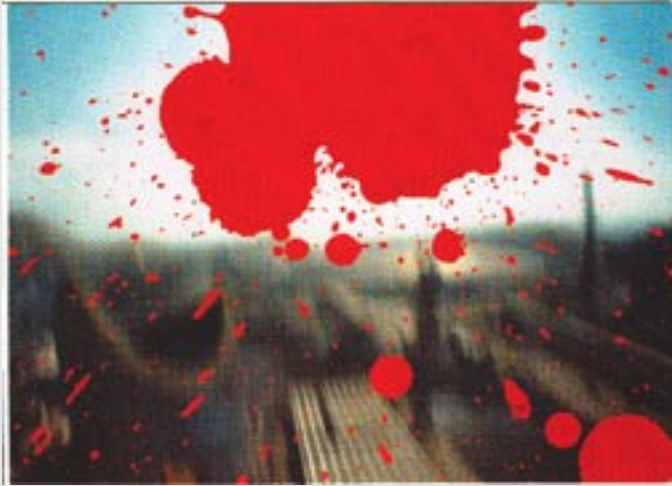
Shomei Tomatsu: Japan World Exposition, Osaka, 1970, printed 2003 . Right Eiko Oshima, 1961, printed 2003

A major retrospective dedicated to post-war Japanese photographer Shomei Tomatsu who specialized in documentary photography centered on the anxiety, pain, joys and surprises of daily life during a period of full-fledged political and social change. On exhibit 260 works created over a period of fifty years that portray the people, cities and rural areas of the Land of the Rising Sun.