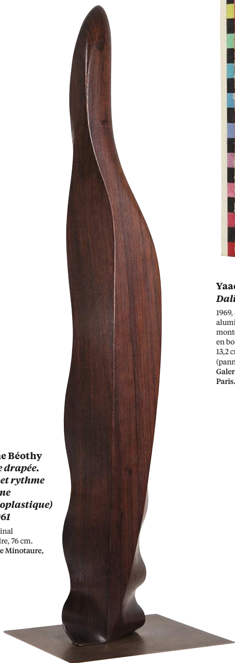
Étienne Béothy Femme drapée. Forme et rythme (Flamme rythmoplastique) Opus 061

Des toiles rares de Le Corbusier à des ensembles prodigieux de Lucio Fontana ou Alighiero Boetti, les galeries modernes de la Fiac rivalisent de beauté avec les plus grands musées. Aperçu.