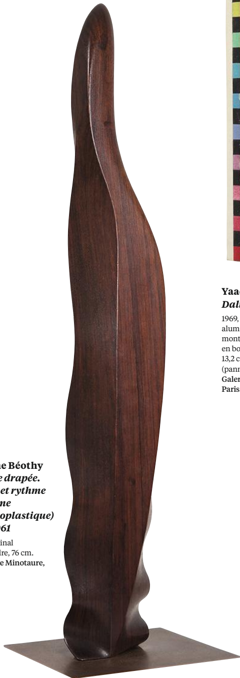
Étienne Béothy Femme drapée. Forme et rythme (Flamme rythmoplastique) Opus 061

Des toiles rares de Le Corbusier à des ensembles prodigieux de Lucio Fontana ou Alighiero Boetti, les galeries modernes de la Fiac rivalisent de beauté avec les plus grands musées. Aperçu.